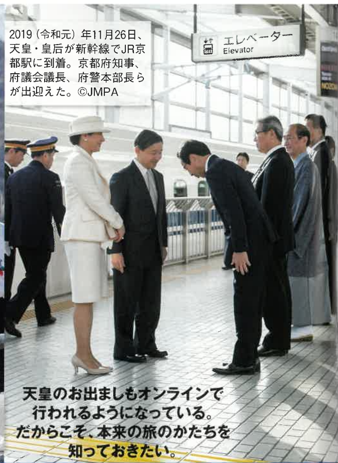
2019(令和元)年11月26日、天皇・皇后が新幹線でJR京都駅に到着。京都府知事、府議会議員、府警本部長らが出迎えた。

天皇のお出ましもオンラインで行われるようになってい。だからこそ、本来の旅のかたちを知っておきたい。