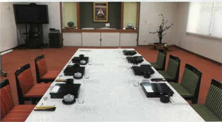
日高市産ゴールデンボーク生姜焼き コールスローサラダ