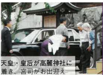
天皇・皇后が高麗神社に着き、宮司がお出迎え

2017年9月20日 埼玉県への行幸啓で ホテル・ヘリテイジ 飯能sta.が 調理・給仕した昼食