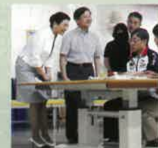
↑センターで利用者に声をかける天皇・皇后。

19（令和元）年9月の新潟県への行幸啓で、天皇・皇后は新潟県障害者リハビリテーションセンターを訪問。同センター理事長の荻庄則幸氏が新潟市医師会報に、そのときのことを以下のように綴っている。