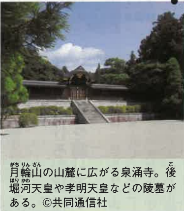
月輪山の山麓に広がる泉涌寺。後堀河天皇や孝明天皇などの陵墓がある。

京都駅前でも多くの市民が出迎え、天皇・皇后がそれに応えた。人々が持つ日の丸の小旗は、訪問先の自治体が配布するほか、保守系団体が配ることもある