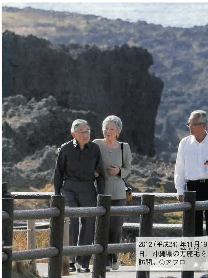
2012(平成24)年11月19日、沖縄県の万座毛を訪問。