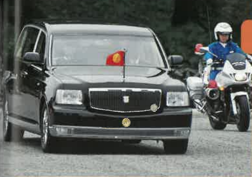
↑センチュリーロイヤルは全長6m超。8人乗りの大型車だ。皇室はこの車を4台所有。

現在の御料車（皇室の方々が乗る車）はトヨタ・センチュリーとセンチュリーロイヤル。訪問先で乗る御料車は、宮内庁職員が東京から運転して運ぶことが多い。御料車の前後には警備や随行者の車が並ぶが、その詳細は左ページ端の図版参照