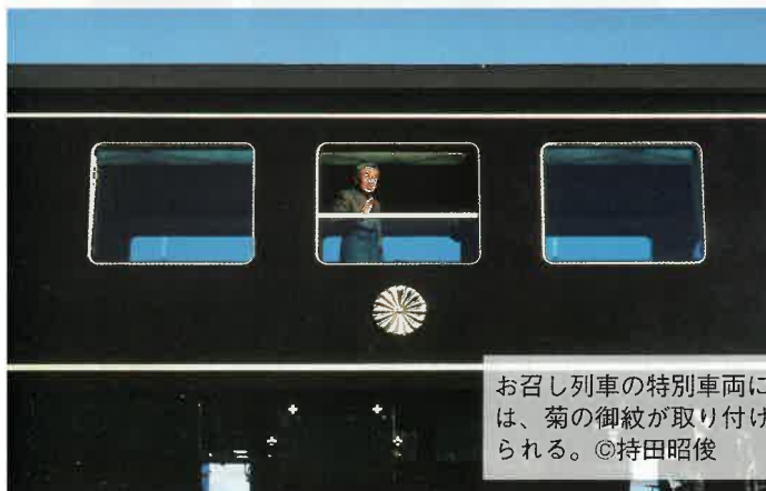
お召し列車の特別車両には、菊の御紋が取り付けられる。