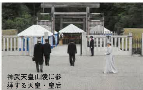
神武天皇山陵に参拝する天皇・皇后

地方行幸啓での車列の一例。被災地を訪れるときなどは小規模になる。宮内庁総務課長らが数ヵ月前から何度も現地入りして、移動ルートや訪問地の下見、打ち合わせを行う。参考資料/井上亮『象徴天皇の旅 平成に築かれた国民との絆』(平凡社新書)